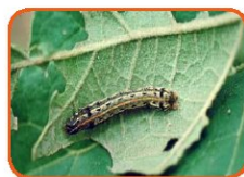
کرم برگ‌خوار پنبه